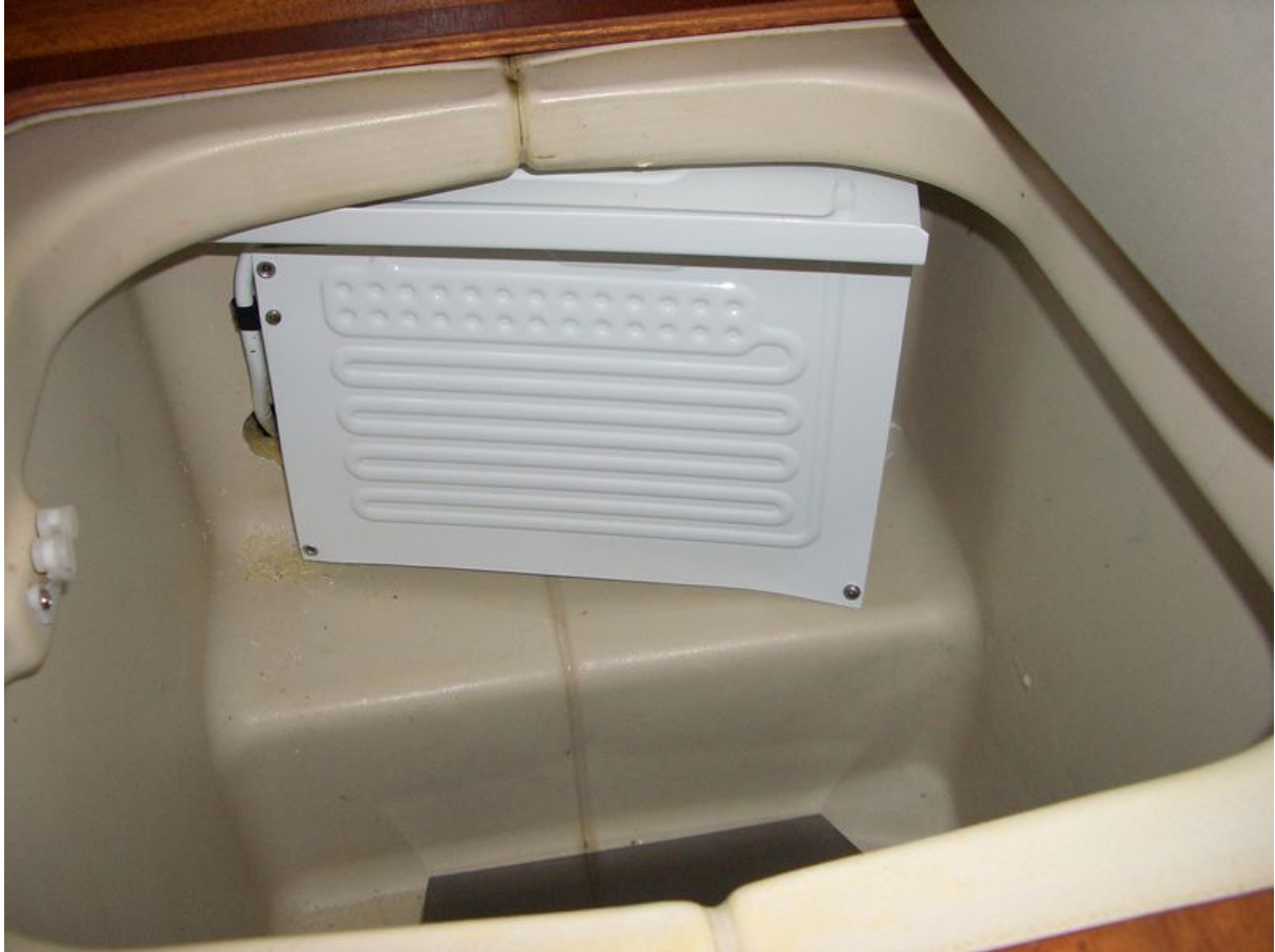
Der Verdampfer im Kühlfach