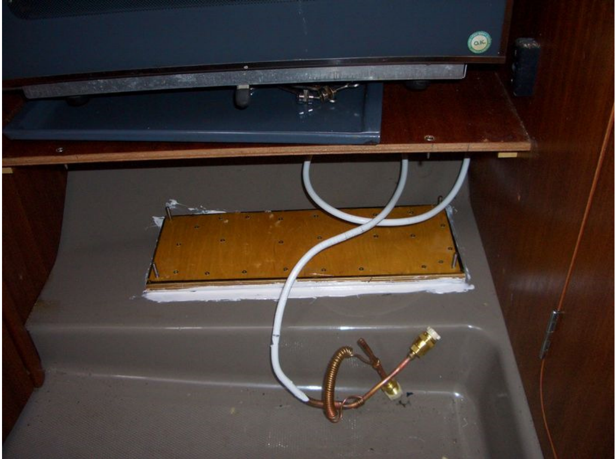
Einkleben der Sperrholzplatte in das Schapp unter dem Herd mit Sikaflex