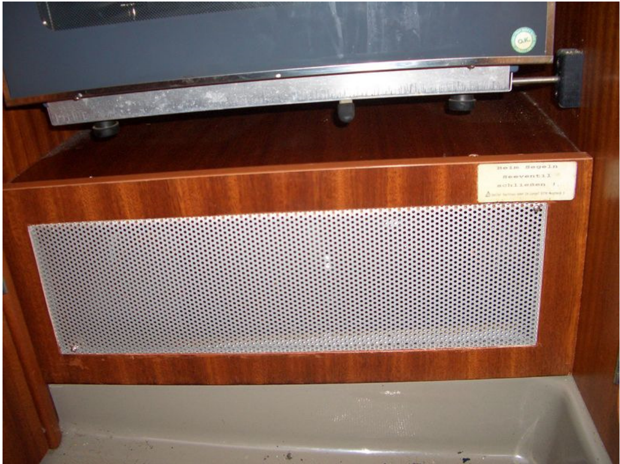
Anbringen des Rahmens