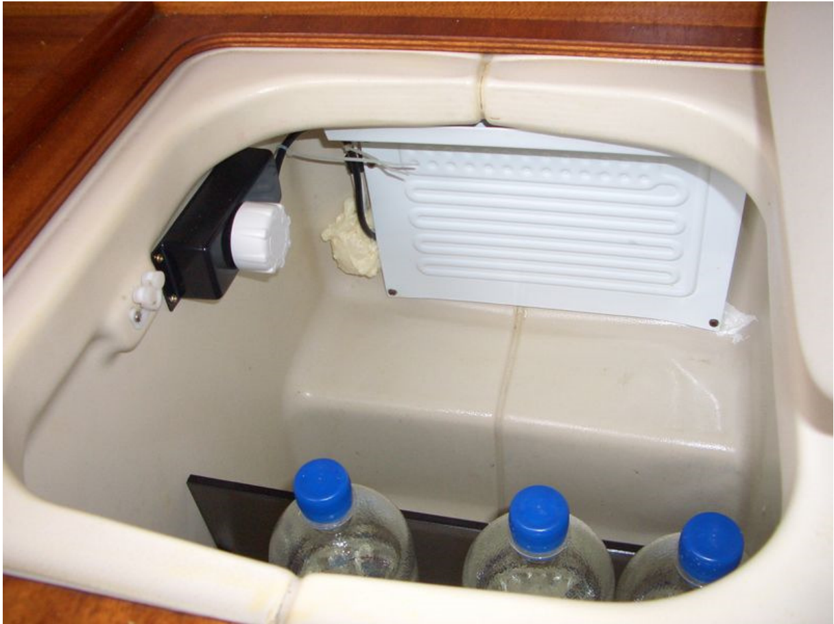
Den Schalter habe ich im Kühlschrank montiert